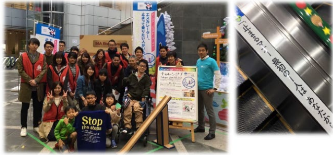
「チャレンジ！東京for2020 エスカレーター止まって乗りたい人がいる」 (東京2020参画プログラム 2018年11月 光が丘IMA)