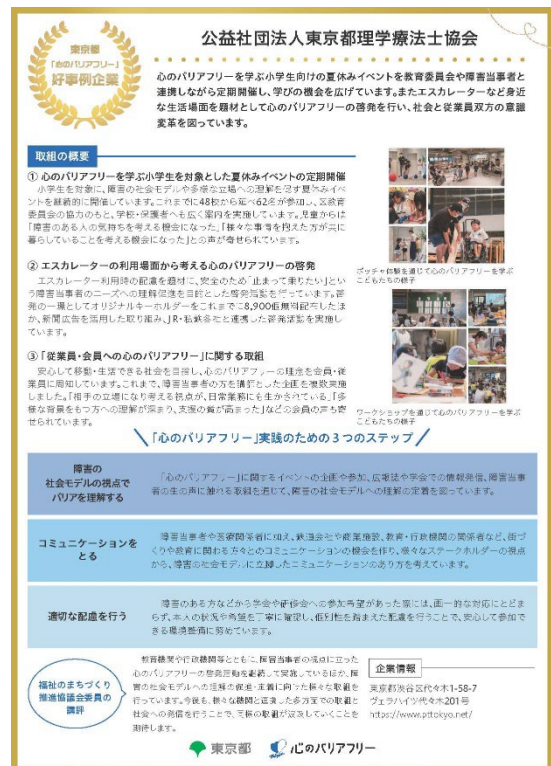
「心のバリアフリー」に関する当協会の取り組み