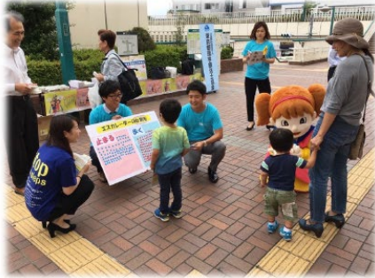
第36回東京都理学療法学会大会 併催イベント (2017年5月)