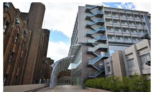
The University of Tokyo The Institute of Medical Science 附属病院