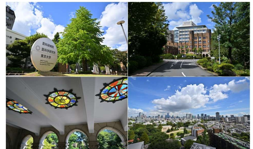
The University of Tokyo The Institute of Medical Science 附属病院

あたたかい全人的医療と先端的医療を実践する。 倫理性・科学性・安全性に基づいた革新的医療を開発する。 透明性を保ちつつ、患者の権利を最大限に尊重する。