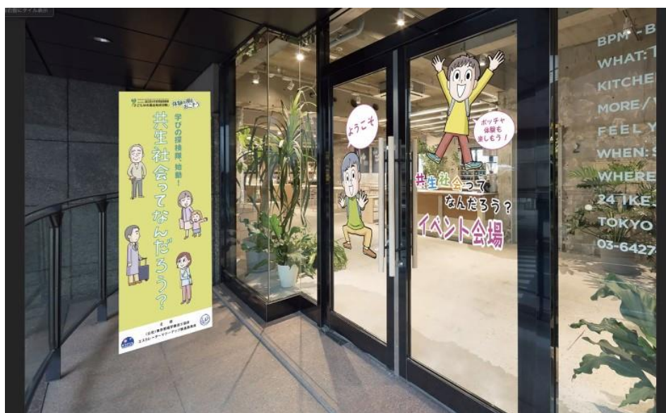
(会場のエントランス)

今回の体験イベントは、障がいを持つ子どもとそうでない子どもが、無理なく一緒になって学べる場を目指し準備を進めて参りました。具体的には、本会が開発したまんが教材「わけがあつてこちら側に止まっています～心のバリアフリー～」を活用したワークショップやボッチャ体験を予定しています。体験イベント中は現役の学校の先生や理学療法士らが全面的にサポートを行うなど、児童らが安心して学べる環境をご用意しています。